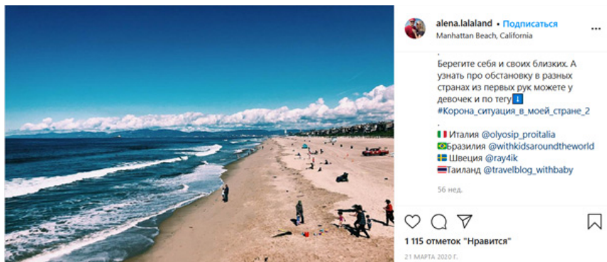
Рис. 1. Пример поста, участвующего в формировании глобальной общественности

В один день от нескольких до десятков блогеров из разных стран публикуют посты на одну и ту же тему, в которые входят тематический хештэг (например #страховка_в) и прямые ссылки на пяти-десяти блогеров из другой страны (см. рис. 1).