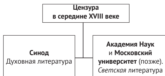
Схема 1. Общее деление цензуры на светскую и духовную в середине XVIII века

В общих чертах мы имеем довольно простую схему (см. схему 1).