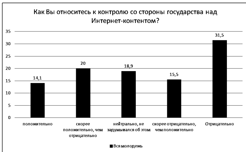
Рис. 3. Отношение респондентов к контролю со стороны государства над интернет-контентом

Подчеркнем специфику отношения молодежи к развитию онлайн-сетевых политических организаций в зависимости от профессиональной стратегии, которую реализуют опрошенные. Сегментация респондентов по типу профессиональной стратегии была осуществлена с применением кластерного анализа (методом К-средних программного обеспечения SPSS Statistics 24.0). В результате получены данные о трех видах опрошенных, реализующих различные профессиональные стратегии: «идеалисты» (ориентированы на профессиональное становление, вместе с тем не готовы к активному и прагматичному протраиванию карьерной траектории), «прагматики» (нацелены на активную профессионализацию, учитывают инструментальные характеристики выбранной профессии, готовы к рациональному моделированию карьерного трека), «традиционалисты» (обладают низким потенциалом профессиональной адаптации, не уверены в своем профессиональном выборе, пассивны в процессе освоения профессиональных компетенций). Согласно данным исследования, «идеалисты» чаще, чем представители других профессиональных стратегий положительно оценивают возможности ана-