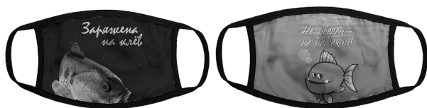
Илл. 12. Маска «Заряжена на клев» и маска «Не уверен – не подсекай!»

Вторая группа изображений на масках посвящена собственно рыбам, и эти изображения несут отпечаток древнейших представлений о рыбах, как хтонических существах, соединяющих разные миры, на которых не распространяется выражение «нем как рыба», поскольку они способны сообщать полезную информацию (маска «Заряжена на клев») или предупреждать (маска «Не уверен – не подсекай!»).