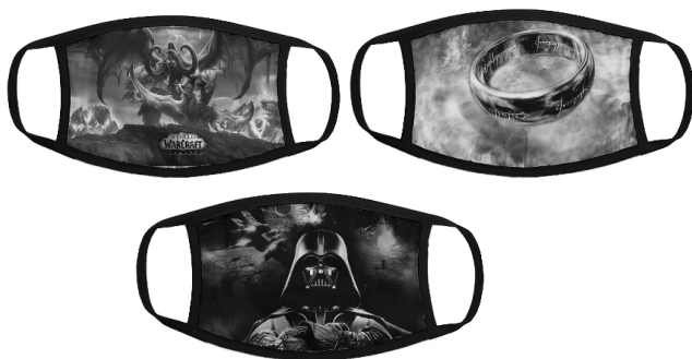
Илл. 14. Маски с кадрами фантастических фильмов Warcraft , «Братство кольца», «Звездные войны»

Вейдер, который значительную часть сериала находится на службе у «сил зла», но в конечном итоге возвращается на «светлую сторону силы», может рассматриваться и как способ традиционного устрашения с помощью рисунка, и как способ вызвать аллюзию с его затрудненным дыханием, поскольку современные даже самые технологичные защитные санитарные маски не позволяют дышать свободно.