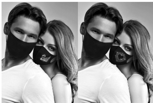
Илл. 17. Парные маски с изображениями лебедя и сердечка

Маски, выражающие семейные ценности, представлены «парными» масками, которые и на сайте демонстрируют «семейные» пары или пары «влюбленных», примером могут служить маски с изображением сердечка (символом сердечной привязанности) или лебедя. При этом маска мужчины однотонная (черная), а на женском варианте маски (того же цвета) имеется изображение лебедя или сердечка 1 . Изображение лебедя означает верность, а изображение сердечка – символ романтической привязанности. Возникает вопрос, почему на парных масках изображение представлено только на одной из них, но, возможно, дизайнер счел, что данные изображения на «мужской» маске будут снижать впечатление мужественности, которое мужчина должен нести в «паре».