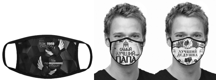
Илл. 18. Маски «Как папа сказал, так по-маминому и будет», «Самый лучший папа», «Самый лучший дедушка»

торые отражают различные аспекты массового сознания в семейной сфере: «Хоть полсвета обойти, лучше мамы не найти», провокационная надпись на «мужской» маске «Как папа сказал, так по-маминому будет» (отзывы на момент исследования отсутствовали), «Самый лучший папа» (надпись сопровождается рисунком стилизованного шлема, который носили витязи, т.е. опять используется образ Героя), «Самый лучший дедушка» (с целой композицией с красными флагами, атрибутами чиновника советской эпохи – чаем в стакане, характерной шляпой и портфелем, а также ящиком для столярных инструментов в медальоне между флагами). Из этого можно сделать вывод, что дедушки полностью отождествляются с советской эпохой и, возможно, с перестройкой).