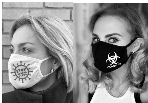
Илл. 1. Маска «Stop coronavirus» и маска «COVID-19»

Маски, прямо подчеркивающие свое назначение – вклад в борьбу с пандемией, напоминают об опасности коронавируса и призывают окружающих соблюдать гигиенические требования во время пандемии. Значительная их часть носит вполне серьезный характер и, как правило, содержит условный значок, обозначающий коронавирус, или его стилизованное изображение, в основе которого компьютерная фотография этого вируса. Такой значок может сопровождать надпись, например, «Stop coronavirus», которая подчеркивает, с одной стороны, цель ношения данной маски, с другой стороны, звучит как древнее заклинание, возможно, эта двойственность сознательно заложена в надписи, тем более что и изображение двойное: слово «stop» заключено в стилизованное изображение коронавируса, и буква «o» в этом слове тоже превращена в значок ковида. В отличие от данного изображения на другой маске стилизованный значок сопровождается надписью «COVID-19», просто фиксирует причины ношения масок.