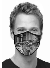
Илл. 15. Маска с кадром из фильма «Девчата».

вы что подумали?»)), и над самим фильмом с не слишком жизненной историей об эталонных отношениях рабочих на стройке.