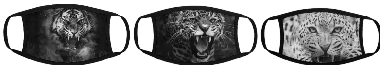
Илл. 16. Маски с реалистичными изображениями представителей семейства кошачьих

Маски, на которых реалистично (обычно с помощью фотографий, но имеются и рисунки) изображены различные животные и птицы, по форме выступают продолжением древней традиции изображения тотемных животных, как правило, не являясь таковыми по сути для их носителей, скорее это олицетворение природной силы, выражение юмористического отношения к жизни носителя маски или стереотипных представлений о реальных или приписываемых данным животным качествах. На защитных масках встречаются реалистичные изображения волков, медведей, зайцев, сов, коровы, белки, слона и различных представителей семейства кошачьих (обычных кошек, ягуаров, леопардов, львов, тигров и др.).