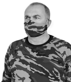
Илл. 4. Фотография модели в маске камуфляжной расцветки

Маска, изображенная на илл. 4, весьма показательна в этом плане, поскольку и сфотографированная в маске модель органична по своему виду для армии или охранных служб, и изображенный мужчина вполне мог бы быть спецназовцем.