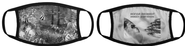
Илл. 11. Маски ихтиологической тематики

Рыбалка – одна из любимых тем для масок нового поколения, однако изображения на масках, посвященные рыбалке, по своему происхождению распадаются на две группы: первая и наиболее многочисленная группа посвящена собственно перипетиям данного увлечения, а также иллюстрирует оценку этого увлечения со стороны и рыболовный юмор. На масках встречаются разнообразные изображения и фотографии улова, рыб, речных заводей и другие, ассоциируемые с рыбалкой, как правило, сопровождаемые серьезными, лозунговыми или юмористическими надписями: «Много рыбы не бывает», «Душа поет, когда клюет», «Самый трудоемкий способ расслабиться», «Рыбак – это не хобби, это – диагноз», «Болен рыбалкой, лечиться не собираюсь», «Рыба это не улов, это – награда», «Когда размер имеет значение» (иллюстрация с противопоставлением нескольких мелких и одной крупной рыбы) и др.