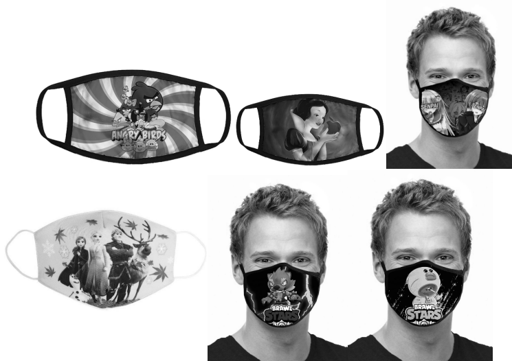
Илл. 13. Персонажи популярных мультфильмов, аниме и видеоигры для мобильных устройств Brawl Stars

Маски, на которых изображены герои мультфильмов, компьютерных игр и кинофильмов, рассчитаны на разнообразных покупателей, как детей, так и взрослых. Среди героев мультфильмов, представленных на масках, имеются герои сериала мультфильмов «Смурфики», несколько изображений на масках взяты из комедийного приключенческого мультсериала о сложных отношениях птичек и свинок Angry Birds , не оставлены без внимания «Кунг-фу панда» (полнометражный анимационный фильм со множеством спецэффектов, повествующий о превращении сына лапшичника в мастера кунг-фу), «Черепашки-ниндзя», «Спящая красавица», «Король-лев», а также популярный сериал мультфильмов «Холодное сердце» (Эльза, Анна, говорящий снеговик Олаф, Кристофф Бьоргман и его верный друг олень Свен), а также персонажи аниме «Сэмпай». Целый ряд масок содержит изображения персонажей видеоигры для мобильных устройств Brawl Stars .