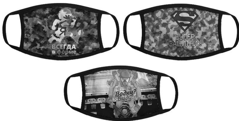
Илл. 5. Маска «Я всегда в форме», «Суперзащитник», «Водку? Буду!»

до зубов вооруженный военный в противогазе, нарисованный в стиле мультфильмов, с надписью «Водку? Буду!», либо изображение на маске фирменного значка Супермена на фоне камуфляжной расцветки (маска «Суперзащитник» со значком Супермена на камуфляжном фоне) призваны усилить эффект защищенности с помощью юмора. Маска «Я всегда в форме», например, помимо иронической демонстрации физической активности подчеркивает субъектную принадлежность этой наглядно демонстрируемой в изображении хорошей физической формы носителю маски с помощью выделения буквы «Я» красным цветом (в противном случае это было бы просто подписью к рисунку человечка в форме).