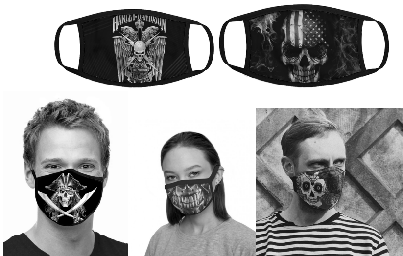
Илл. 8. Маски с символикой легендарного мотоцикла Харлей – Дэвидсон, маски с черепом с флагом США, пиратской символикой, изображением железного черепа – личины, художественно отрисованным изображением черепа

Вместе с тем череп является частью массовой культуры, художники, дизайнеры, ювелиры и другие представители искусства используют его для выражения своих эмоций и идей. На том же сайте OZON представлена интерьерная статуэтка (как определено изделие на сайте) – маска в виде черепа, одетого в свою очередь в маску с надписью COVID-19.