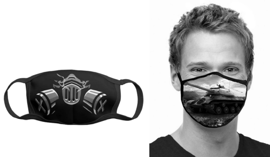
Илл. 6. Маски с изображениями противогаза / респиратора и танка

Маски с изображением денежных средств могут быть также отнесены к группе масок с охранно-защитной символикой. Любопытно, что советская купюра в 100 рублей имеет сдвоенное изображение, российская купюра стоимостью 5000 рублей изображена на маске в единичном экземпляре, а вот американский доллар в большом количестве и в сочетании с денежным долларовым деревом. Интерпретировать это можно по-разному, в том числе и в пользу советско-российской валюты. Вместе с тем маску с изображением долларов можно трактовать как выражение желания владельца маски стать долларовым миллионером, видящего в денежном мешке лучшую защиту от любых напастей. Однако изображения денег имеют много культурных смыслов (как и сами деньги), приведенные изображения на масках только в определенной интерпретации позволяют рассматривать их как своеобразный «оберег», но возможны и другие их интерпретации и рассмотрение в рамках другой тематики, в том числе и самостоятельной.