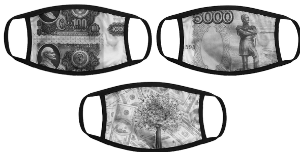
Илл. 7. Маски с изображением денежных купюр