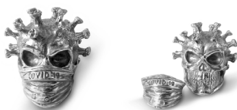
Илл. 9. Маска интерьерная со съёмной защитной маской и надписью «COVID-19»

Вместе с тем череп является частью массовой культуры, художники, дизайнеры, ювелиры и другие представители искусства используют его для выражения своих эмоций и идей. На том же сайте OZON представлена интерьерная статуэтка (как определено изделие на сайте) – маска в виде черепа, одетого в свою очередь в маску с надписью COVID-19.