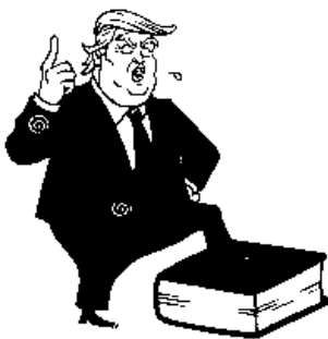
Илл. 9. Доамама (Doamama). Дональд Трамп стоит на тексте (досл. «книге») Конституции

визуально «расплющена» президентом. Эффектная и динамичная поза персонажа не вызывает сомнения в том, что он может встать на нее и обеими ногами, превратив книгу-конституцию в свой постамент, т.е. «перетянув» конституционные нормы на себя, что в истории США уже происходило благодаря концепции так называемой «живой Конституции» [Берлявский, 2014, с. 14–18], позволяющей развивать положения Конституции США 1787 г. различным образом. Но поскольку он стоит на конституции-книге «только» одной ногой, не исключена и ситуация, что ему придется под давлением различных политических сил, обстоятельств или воздействием других органов государства, играющих важную роль в американской системе «сдержек и противовесов», отступить и «убрать с нее ногу». Как будут развиваться события в США дальше, пока неясно, некоторые политологи полагают, что «ни один из важнейших институтов, обеспечивающих разделение властей в США – будь то партийная система, Конгресс, судебная власть или федеративное устройство, – сам по себе и в совокупности с другими институтами не может предотвратить сползания страны к доминированию исполнительной власти, во главе которой стоит авторитарно-популистский лидер» [Ворожейкина, 2017, с. 76]. Художники-карикатуристы редко берутся за комплексное изображение ситуации, когда и конституция страдает серьезными недостатками, и действия законодателей и правоприменителей их не смягчают, а