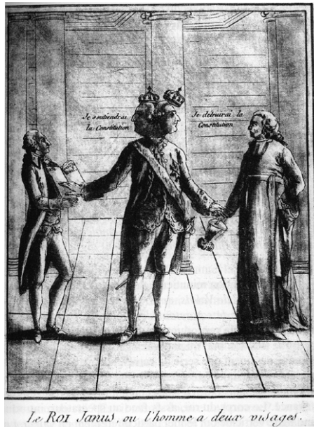
Илл. 1. Король Янус, или Двуличный человек. Анонимная карикатура XVIII в. (издана между 1791 и 1792 гг.). Париж, Музей Карнаваль

Ассоциации между национальной Конституцией и Библией просматриваются в некоторых конституционных процедурах и обычаях, отраженных в произведениях изобразительного искусства. Например, присяга главы государства может приноситься на экземпляре издания национальной Конституции или на Библии, причем выбор не зависит от формы правления: во Франции король приносил клятву уже на первой Конституции 1791 г., а в США президент – на Библии.