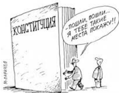
Илл. 8. М. Ларичев. «Пошли, пошли... я тебе такие места покажу!»

При изображении проблем с реализацией конституции в абстрактной форме без персонализации цель карикатуры – привлечь внимание к данному явлению без попытки выявления причин. Примером мягкого и абстрактного выражения недостаточной реализации положений конституции может служить карикатура российского карикатуриста М. Ларичева «Пошли, пошли, я тебе такие места покажу» (илл. 8).