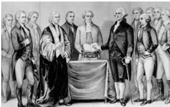
Илл. 2. Джордж Вашингтон приносит присягу Конституции 30 апреля 1789 г. на тексте Библии. Музей Метрополитен

Что же касается картины, изображающей присягу Президента на тексте Библии (илл. 2), то она отражает стремление конституционного законодателя поставить присягающего под ответственность не только перед согражданами, но и перед высшим Судом, который, как сказал поэт, «недоступен звону злата, и мысли, и дела он знает наперед». Давая клятву верности конституции на Библии, присягающий несет двойную ответственность: перед Богом и людьми.