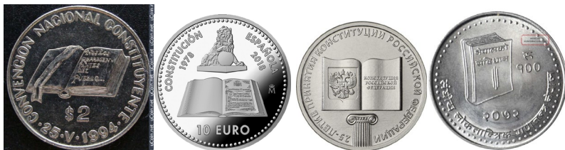
Илл. 4. Юбилейные монеты, посвященные конституции (конституционной реформе 1994 г. в Аргентине, сорокалетию Конституции Испании 1978 г., 25-летию Конституции России 1993 г., принятию Конституции Непала 2015 г.)

Официальную позицию незыблемости и значимости конституции для государства и, соответственно, правовой системы страны несут и юбилейные монеты, посвященные ей. Такого рода произведения обычно создаются по определенному шаблону, где книга изображает собственно конституцию, а ее высокая оценка воплощается вспомогательными средствами, как, например, на юбилейных монетах (илл. 4).