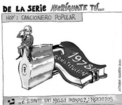
Илл. 6. Э. Наварро (E. Navarro). Сегодня: Песенник народных песен

Критическая оценка содержания конституции в некоторых странах может быть даже непосредственной реакцией на определенные конституционно-правовые теории. Это свидетельствует о достаточно высоком уровне правовой культуры общества в целом и самого автора произведения. Яркий пример – карикатура Э. Наварро (илл. 6). Для Испании карикатура об «открытости» конституции является реакцией на научную конституционно-правовую доктрину «открытой конституции» ( Constitución abierta ), активно используемую испанскими политиками. Суть данной теории состоит в том, что «открытому» обществу (т.е. обществу, в котором укоренились свобода, правосудие, равенство и демократия) должна соответствовать «открытая конституция», т.е. конституция, признающая, инкорпорирующая и обеспечивающая институты и реалии, которые двигают прогресс на международном, европейском и иных уровнях [Lucas Verdú, 1993, p 95; Schwartz, 2018, p. 1103–1116].