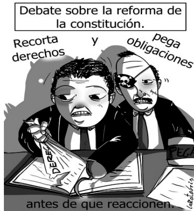
Илл. 7. Ла Рата Грис (La Rata Gris). Правка конституции «вручную»

Идея дефектности конституции, отсутствия в ней каких-то необходимых для общества положений влечет потребность в ее «лечении», улучшении и конституционной реформе. Но здесь важно, каким образом и в каком направлении будет осуществляться эта реформа. Наиболее опасными художникам-карикатуристам представляются изменения, затрагивающие права человека. Приведем в качестве примера карикатуру испанского карикатуриста Ла Рата Грис «Правка конституции «вручную»» (илл. 7).