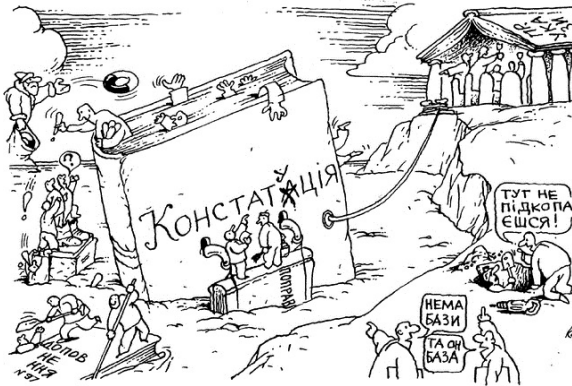
Илл 10. А. Казанский. Без названия

усиливают. К числу таких редких карикатур относится работа украинского художника А. Казанского (илл. 10), напечатанная в 1996 г.