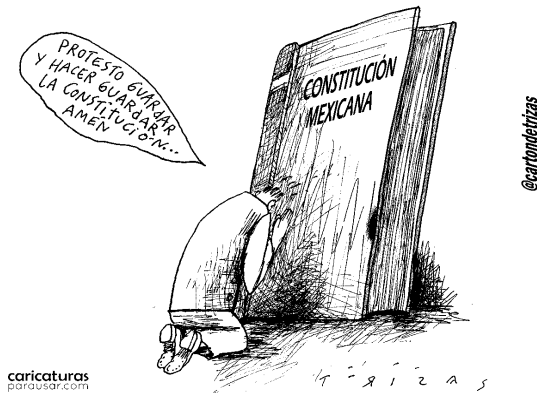
Илл. 3. Трисас (Trizas). Ты не будешь грешить

Следует, однако, отметить, что прием увеличения размера конституции далеко не всегда используется для ее апологии. В карикатурах постмодернистского толка нередко присутствуют образы-«перевертыши», которые, благодаря своей парадоксальности, способны сильнее воздействовать на зрителя. Рассмотрим в качестве примера карикатуру, посвященную действующей Конституции Мексики 1917 г. (илл. 3).