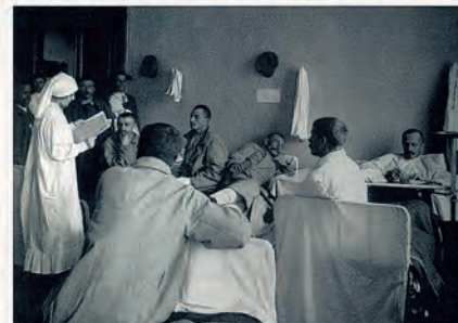
Раненые Первой Мировой. Временный госпиталь в частном училище Мазюга, Москва

На осень 2014 г. запланировано проведение в ИНИОН РАН международной научной конференции «Россия в Первой мировой войне: Новые направления исследований» (ориентировочные даты — 11–12 октября). Мы надеемся опубликовать более подробную информацию в самое ближайшее время, после того как будут уточнены все технические вопросы. Конференция проводится совместно с Германскими историческими институтами в Москве и Франко-русскими центрами гуманитарных и общественных наук в Москве.